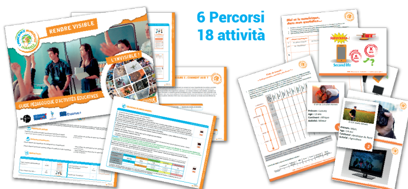
6 Percorsi 18 attività

Abbiamo sviluppato 6 percorsi composti da 18 attività pedagogiche per la classe. Si tratta di attività educative di durata variabile tra 30 min e 2 ore circa. Esse possono essere realizzate le une separatamente dalle altre oppure secondo un ordine dato dall'interesse didattico del singolo docente/formatore. Le attività sono state pensate per essere realizzate senza attrezzature digitali particolari. Si tratta di attività di studio di documenti (testi, immagini, foto), dibattiti filosofici, simulazioni, giochi di ruolo e lavori di gruppo, collaborativi o cooperativi.